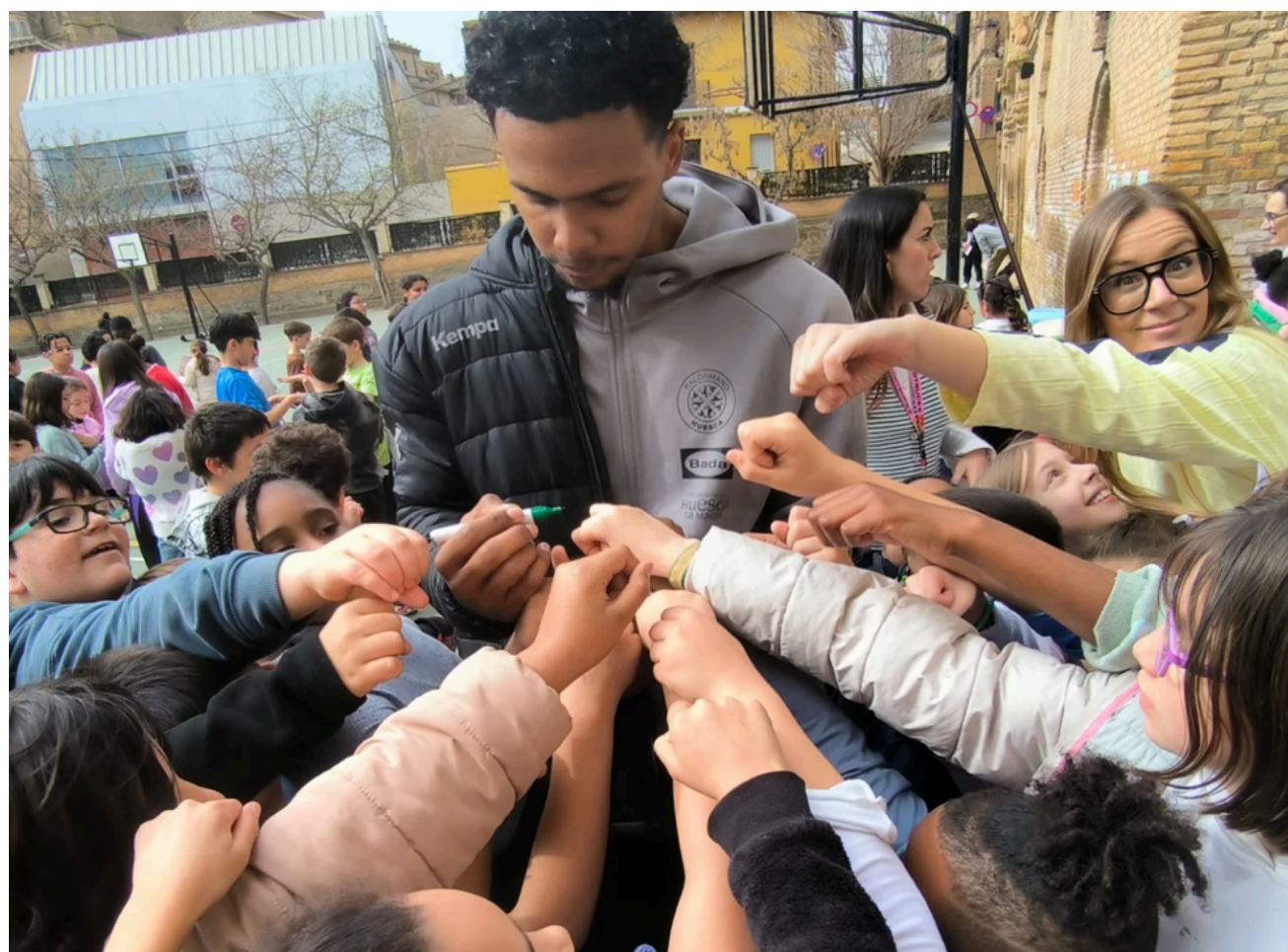
Colegio San Viator

Además, durante estas visitas se han trabajado valores como el esfuerzo, el trabajo en equipo y el respeto, reforzando el papel del deporte como herramienta educativa. De este modo, el club fortalece su vínculo con la comunidad educativa y promueve hábitos de vida saludables entre los jóvenes.