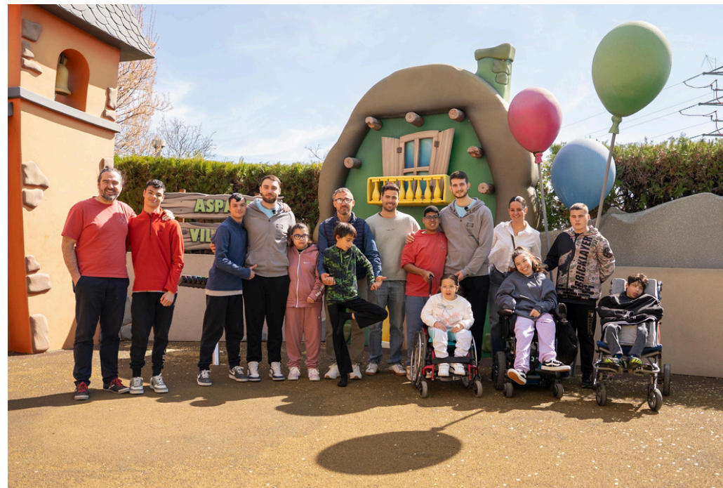
Fotografía de la visita a ASPACE Centro de ASPACE

Durante la temporada, varios jugadores del primer equipo realizaron una visita al centro ASPACE, donde pudieron compartir una jornada muy especial con los usuarios de la asociación. La actividad permitió acercar el balonmano a los niños y niñas del centro, generando un espacio de convivencia, cercanía y aprendizaje mutuo.