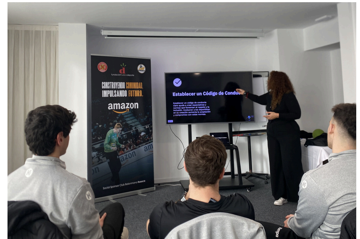
Taller formativo impartido por Cruz Roja Hotel Abba

Además, se desarrollaron talleres formativos para entrenadores y monitores de la cantera, impulsados por Cruz Roja Juventud, con el objetivo de dotar al personal técnico de herramientas para detectar y actuar ante posibles casos de acoso. La iniciativa se completó con una charla dirigida a los jugadores de la cantera gracias a la colaboración de la Plataforma del Voluntariado de Aragón, reforzando el compromiso del club con la formación en valores y la creación de entornos deportivos seguros.