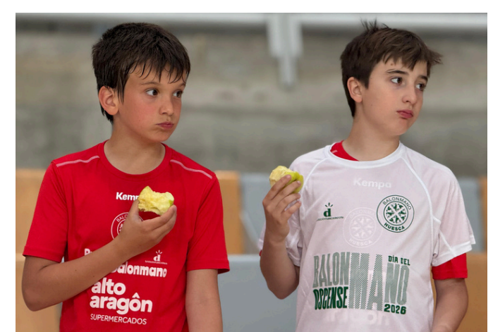
Fotografías de los eventos del Día del Balonmano Oscense Palacio de los Deportes