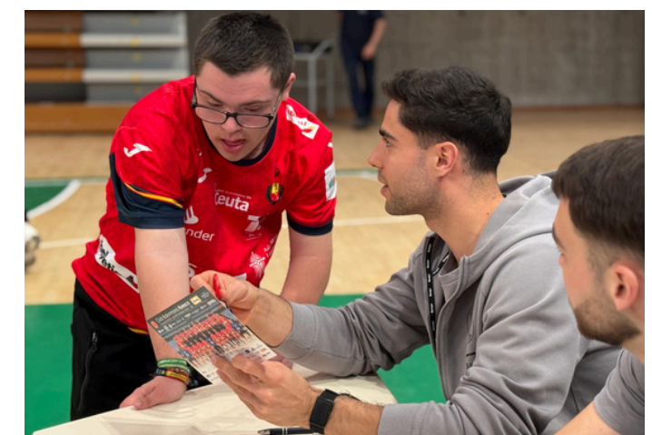
Fotografías de los entrenamientos inclusivos Palacio de los Deportes