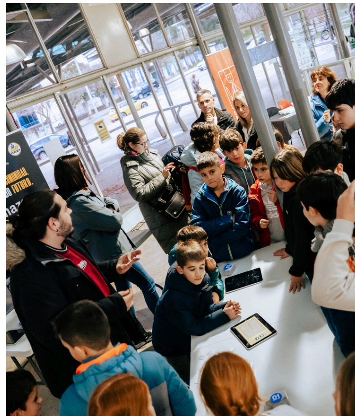
Taller tecnológico impulsado por Amazon Palacio de los Deportes